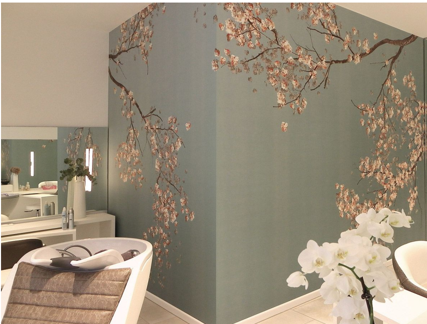
Grafik mit Kirschzweigen für einen Friseursalon

Das besondere am digitalen Tapetendruck ist, dass dieser Rapport, also die Wiederholung eines Motivs, nicht an die Breite einer Tapetenbahn gebunden ist. Motive können also auch frei von einem festen Raster auf der Wand angeordnet werden. Dadurch ergeben sich ganz neue Gestaltungsmöglichkeiten, die ich zu erforschen versuche.